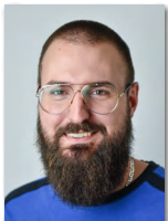
Alexander Gegic Technik (Schächte)

Telefon +49/86 33/509 64-12 E-Mail teising@haba-beton.de