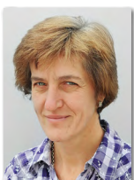
Theresia Meindl Frachtgutschrift

Telefon +49/86 33/509 64-21 E-Mail teising@haba-beton.de