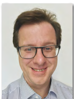
Kassian Gunsch Versand

Telefon +49/86 33/509 64-36 E-Mail teising@haba-beton.de