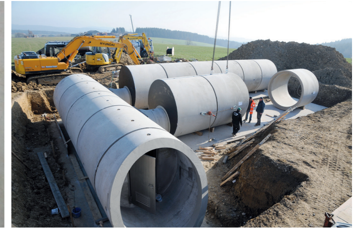
Verlegung: Nachdem die Bodenplatte vorbereitet wurde, dauerte das Verlegen der einzelnen Rohre für den Speicher lediglich zwei Tage.

und die erste Bauphase konnte beginnen – es war die wichtigste und schwierigste: „Am meisten mussten wir bei der Verlegung des ersten Rohres aufpassen“, erzählt Leikermoser. Das erste Rohrstück muss absolut exakt positioniert werden, so dass die folgenden Rohre perfekt dazu passen. Insgesamt sind es achtzehn schalungserhärtete Stahlbetonrohre DN 2600, mit einer Wandstärke von 25 Zentimetern, einem Außendurchmesser von 3,10 Metern und einem Gewicht von 19,5 Tonnen. Die Schieberkammer, in der sich die Technik befindet, ist der zentrale Teil der neuen dreiteiligen Anlage. Sie liegt quer zu zwei weiteren Kammern, den beiden Trinkwasserbehältern.