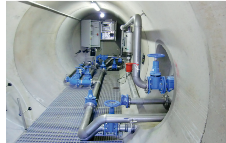
Schieberkammer: Nach der Verlegung der Rohre, wurde die Schieberkammer mit entsprechender Technik ausgestattet